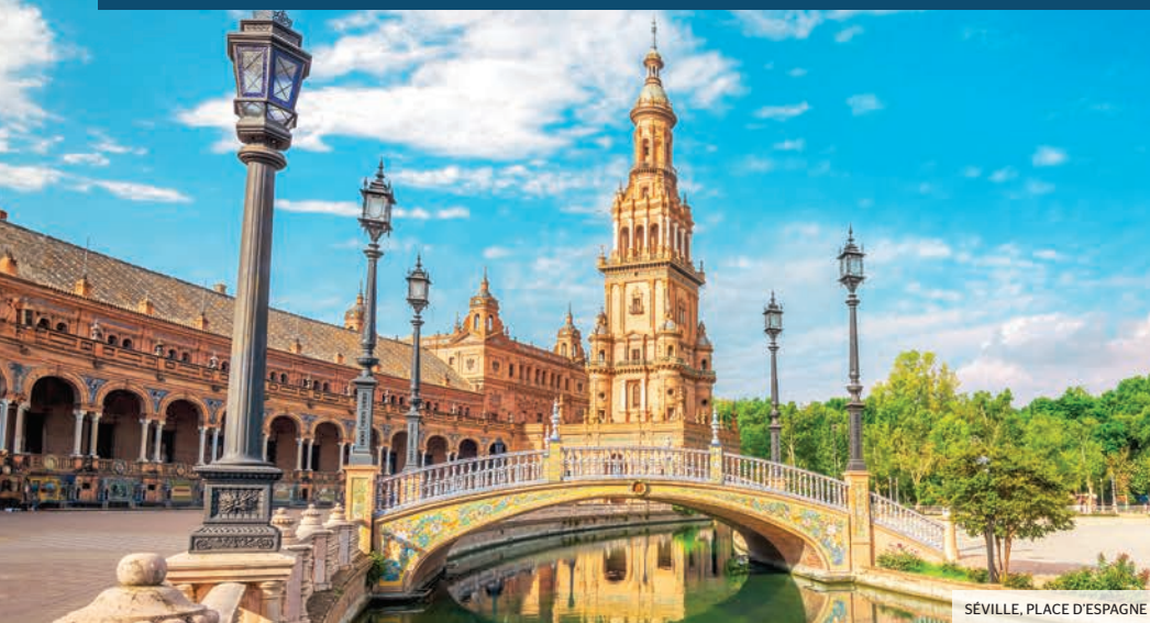
SÉVILLE, PLACE D'ESPAGNE