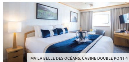
MV LA BELLE DES Océans, CABINE DOUBLE PONT 4