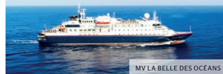
MV LA BELLE DES Océans