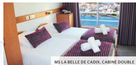
MS LA BELLE DE CADIX, CABINE DOUBLE