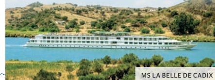
MS LA BELLE DE CADIX