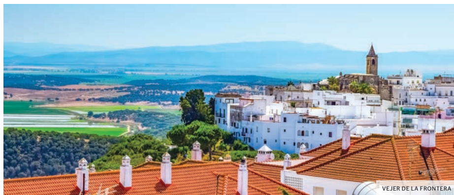
VEJER DE LA FRONTERA

Petit déjeuner buffet à bord. Débarquement. Transfert à l'aéroport. Formalités. Envol pour Nice.