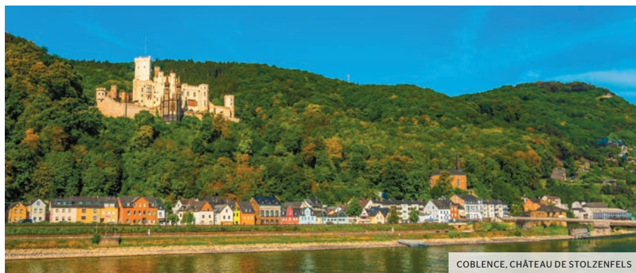
COBLENZE, CHÂTEAU DE STOLZENFELS

Petit déjeuner buffet à bord. Arrivée à Strasbourg. Débarquement. Puis, nous entamons notre itinéraire retour vers Belfort et la Franche-Comté, par l'axe autoroutier de l'Est... Traversée de la Bourgogne vers Chalon. Déjeuner libre en cours de route. Puis, retour direct sur les Alpes Maritimes pour rejoindre votre localité de départ en fin de soirée.